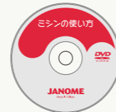
使い方がよくわかる 説明DVD