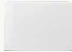
ミシンを守るハードケース